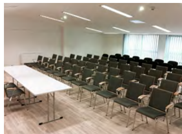
Studio 1 - großer Seminarraum (Beispiel Kinobestuhlung )