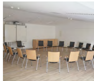
Studio 1 - großer Seminarraum (Beispiel Kreis-Form Aufstellung )