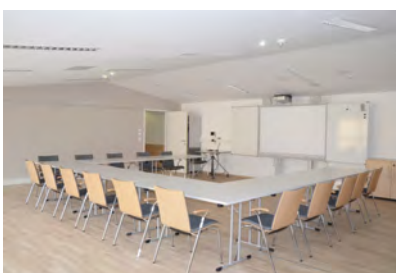
Studio 1 – großer Seminarraum (Beispiel U-Form-Aufstellung)